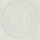
EXHIBIT NO. 1 LIST OF THE STATES