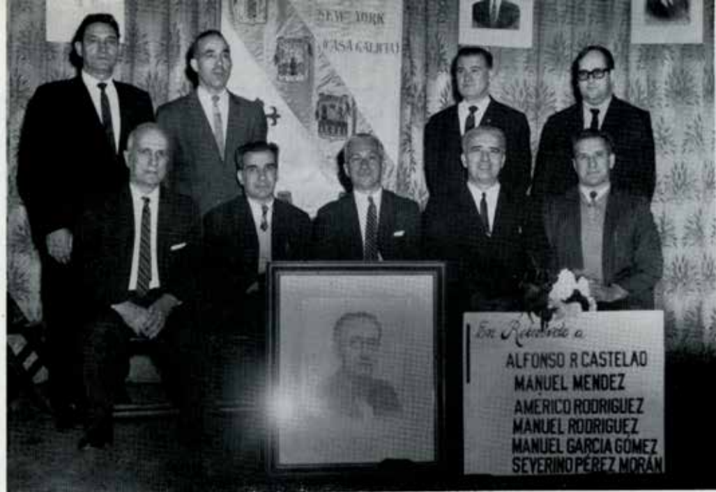
El comité organizador del acto