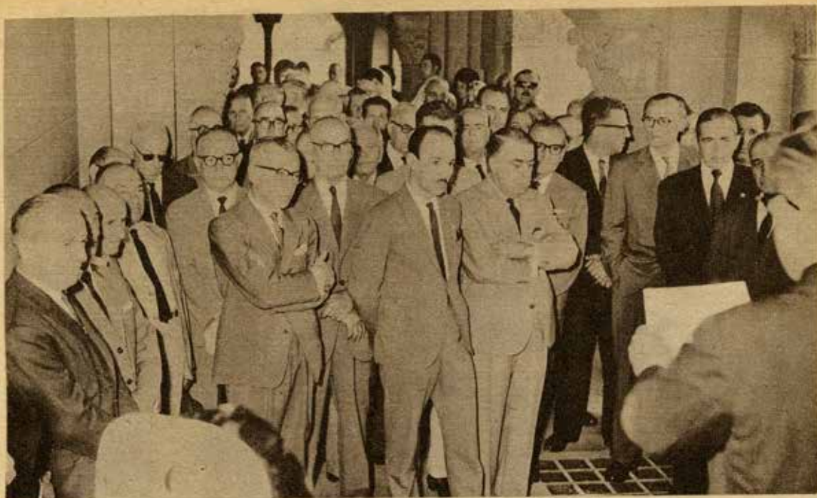
Del homenaxe a la memoria de Castelao en nuestro Panteón Social