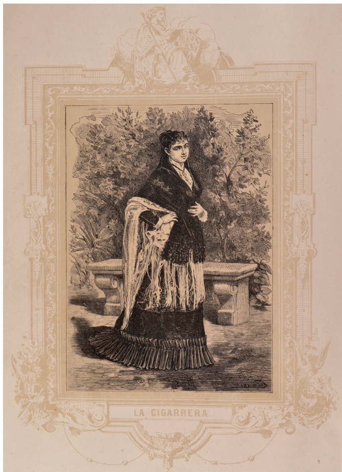
Gravado de Labarta en Las mujeres españolas, americanas y lusitanas pintadas por sí mismas . 1881