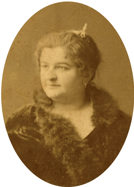
Emilia Pardo Bazán, 1884. Este retrato amósase tamén na Casa-Museo Benito Pérez Galdos en Gran Canaria ao ser o envío que ela lle fixo ao escritor.