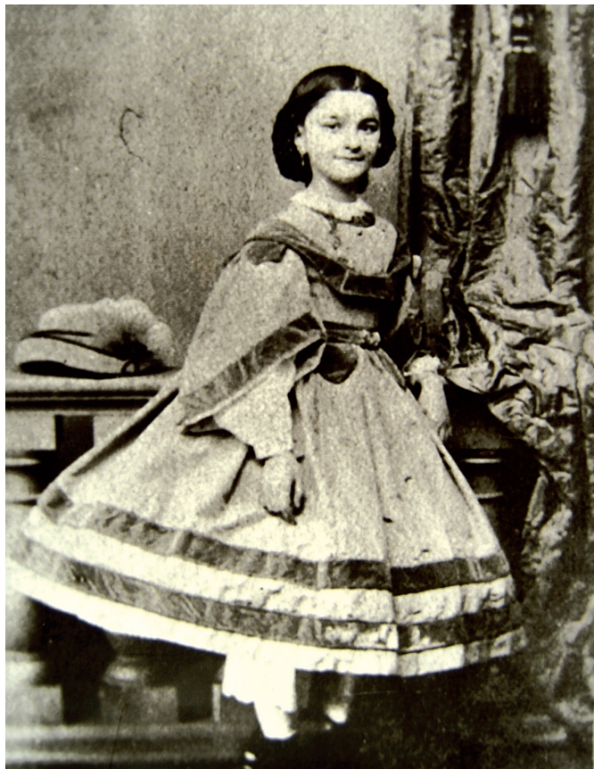
Emilia Pardo Bazán. 1859-6?