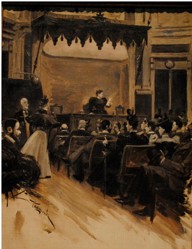
“Emilia Pardo Bazán no Ateneo de Madrid. Cátedra de literatura contemporánea” óleo e aguada sobre lenzo. 1897. Autoría de Joaquín Vaamonde.