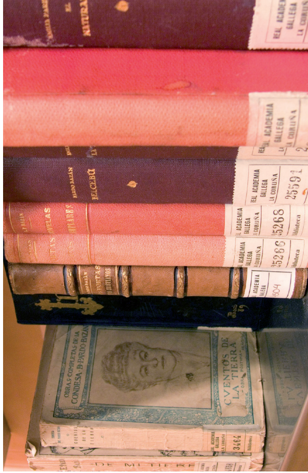
Detalle da vitrina onde se expón a súa obra literaria completa e un extracto da súa biblioteca privada. Composta por 18.000 volumes dedicados manuscritos na súa maioría.