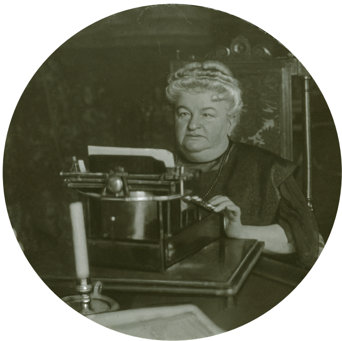
Retrato de Emilia Pardo Bazán, 1920.