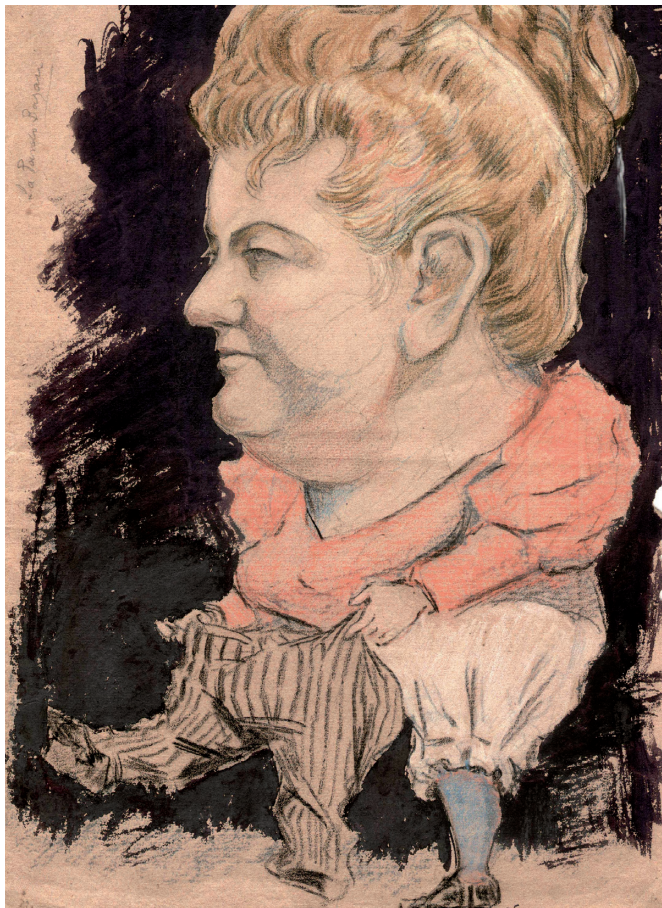
Caricatura colección Museu del Pueblu de Asturias Ca. 1895