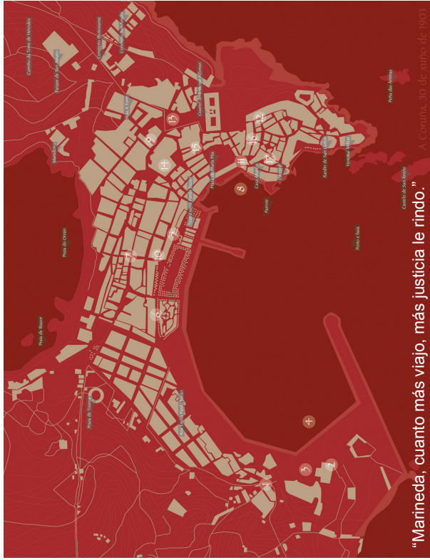
Panel da exposición “Marineda” na sala III da Casa-Museo Emilia Pardo Bazán. Real Academia Galega.