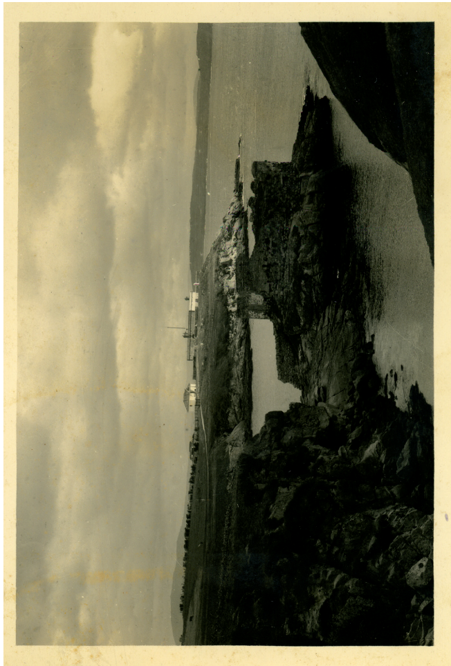
Ruínas do antigo Castelo de San Amaro. Detrás o edificio da Bateria de Durmideiras. (1920 -1935), A Coruña.