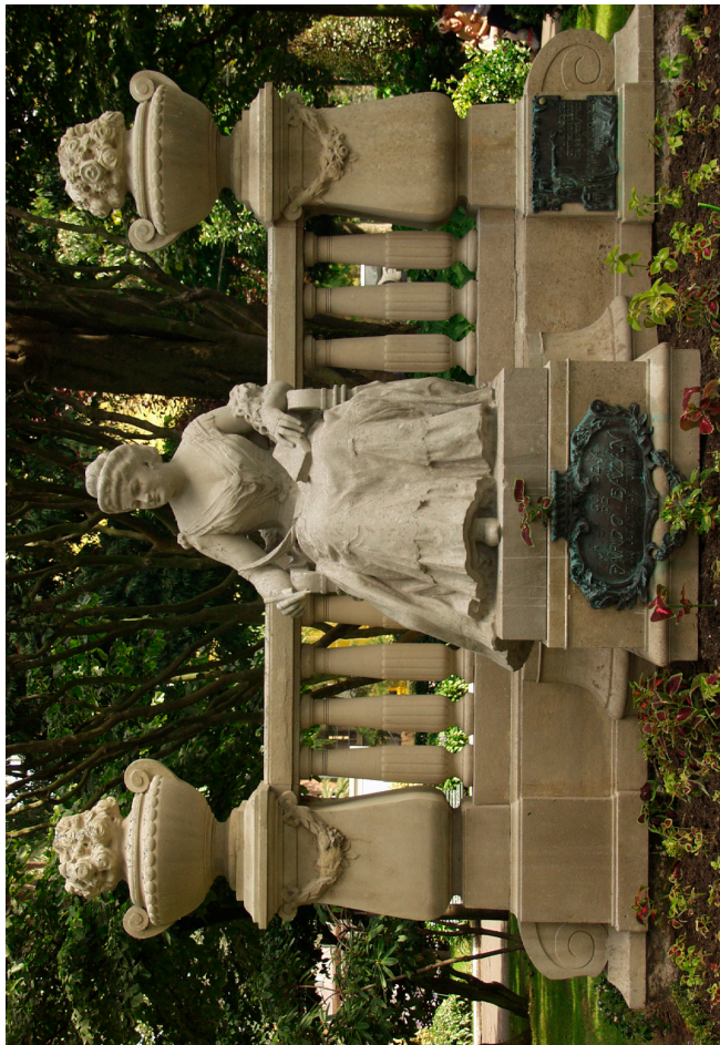
Monumento orixinal dedicado a Emilia Pardo Bazán nos Xardíns de Méndez Nuñez. A Coruña. Da autoría de Collaut Valera, foi inaugurado o 15 de outubro de 1916.