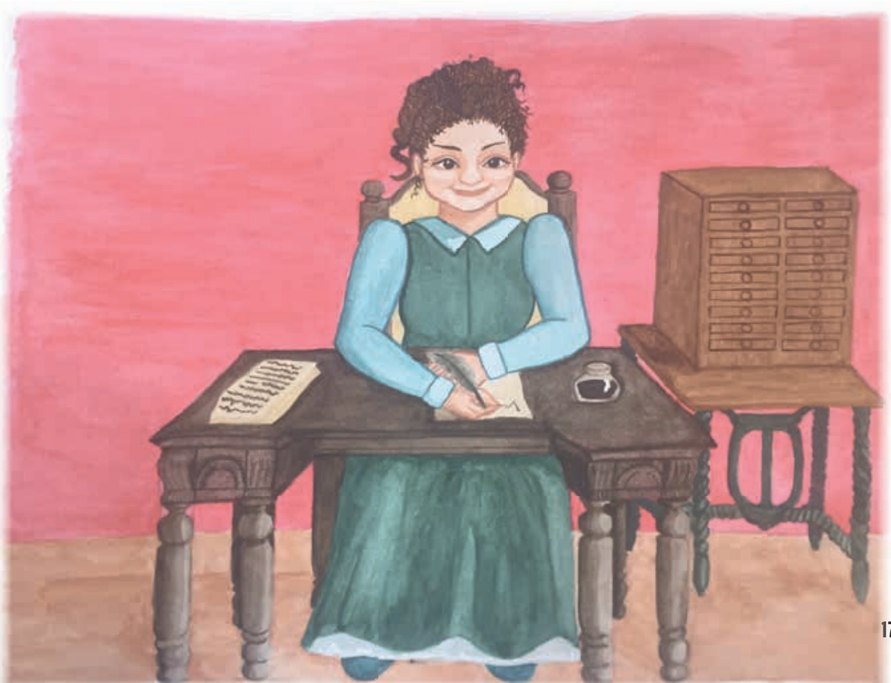
Debuxo: Alba Osorio

Con toda a información que recollades podedes elaborar un xornal con noticias acerca do noso idioma.