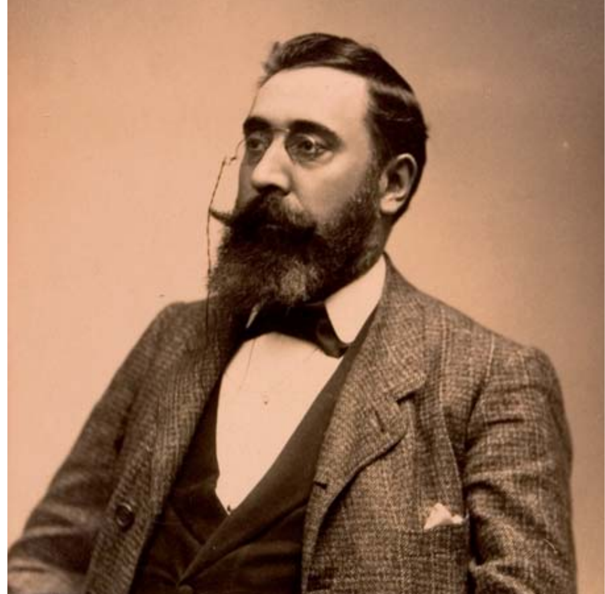
Retrato de Curros Enríquez, posiblemente tirado durante a súa viaxe a Galicia en 1904.

Levou á poesía as preocupacións éticas do seu xornalismo combativo e non renunciou ás preocupacións estéticas na súa palabra axustada na prensa diaria.