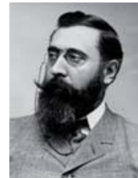
Retrato de Curros Enríquez que preside, xunto con Fontenla Leal e Manuel Murguía o segundo andar da sede da Real Academia Galega.

Curros Enríquez foi nomeado Académico de Honra da Real Academia Galega o 15 de setembro de 1905.