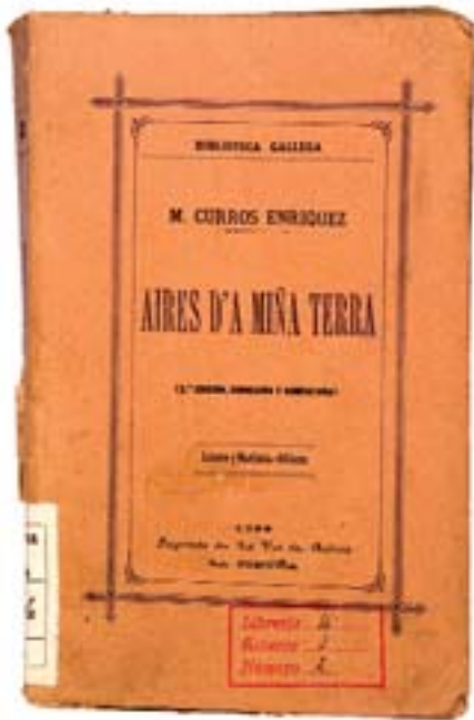
A terceira edición de Aires da miña Terra recolle a versión definitiva realizada polo propio autor. Real Academia Galega

En agosto de 1888 sae do prelo O divino sainete , dedicado “Á mocidade gallega” e que, en palabras do autor, constitúe a súa particular viaxe a Roma en compañía de Añón. Real Academia Galega