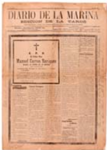
Na sede do xornal cubano foron velados os restos do poeta antes de seren embarcados cara á Coruña. Real Academia Galega