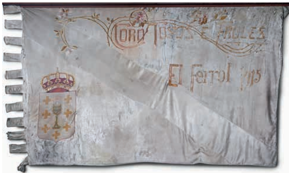
Bandeira galega do Coro Toxos e Froles de Ferrol, 1915, que a conserva actualmente