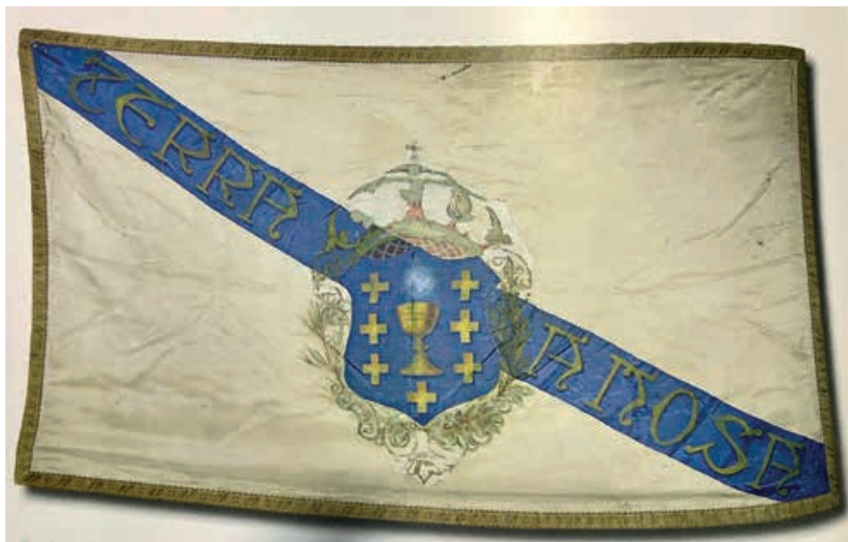
Bandeira galega da Coral de Ruada, 1920, coa lenda Terra a nosa . Deseño de Camilo Díaz Baliño e agasallada á coral pola Empresa Fraga