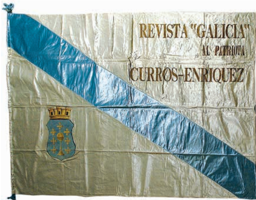
Bandeira de Curros Enríquez, que cubriu o seu cadaleito durante o enterro do poeta na Coruña en 1908. A bandeira fora custeada pola revista Galicia da Habana. Conservada na Real Academia Galega, é a bandeira galega máis antiga que coñecemos