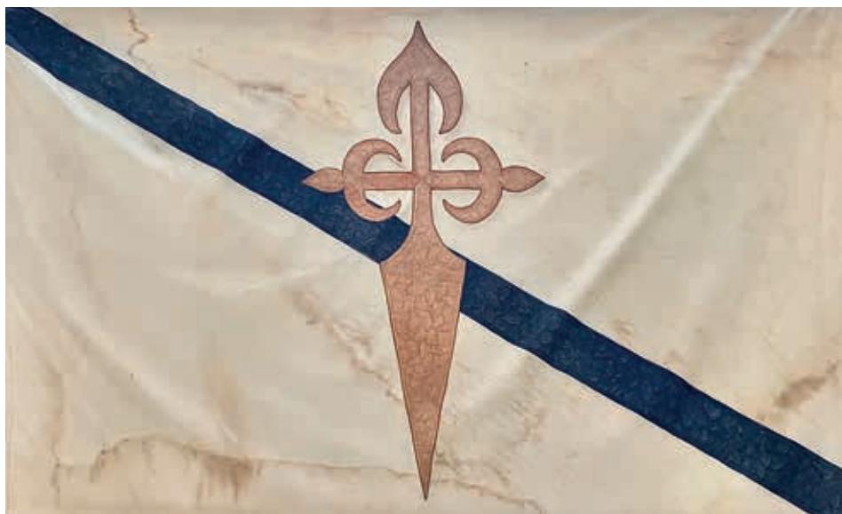
Bandeira galega do Centro Betanzos de Buenos Aires, ca. 1951. Museo das Mariñas