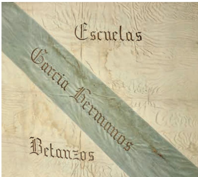
Bandeira galega de 1913, da Escola García Hermanos de Betanzos. Consérvase no Museo das Mariñas