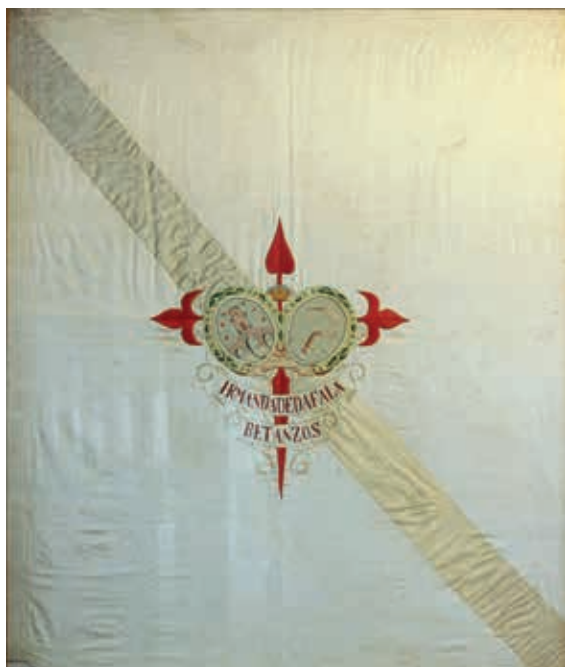
Bandeira das Irmandades da Fala de Betanzos, 1918. Museo das Mariñas