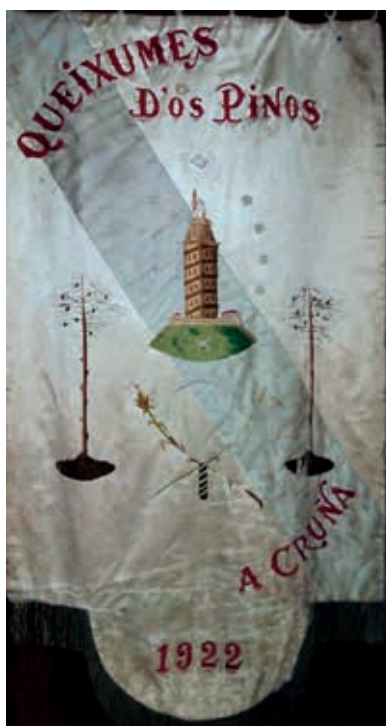
Bandeira galega no estandarte de 1922 do coro Queixumes dos Pinos da Coruña, que inclúe tamén a fouce das Irmandades da Fala. Desaparecido o coro, hoxe consérvase na Coral Follas Novas da Coruña