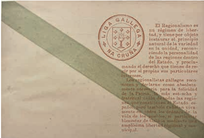
Cartón postal coa bandeira galega, editado pola Liga Gallega na Cruña, partido político constituído polos rexionalistas da Coruña, ca. 1897. Real Academia Galega