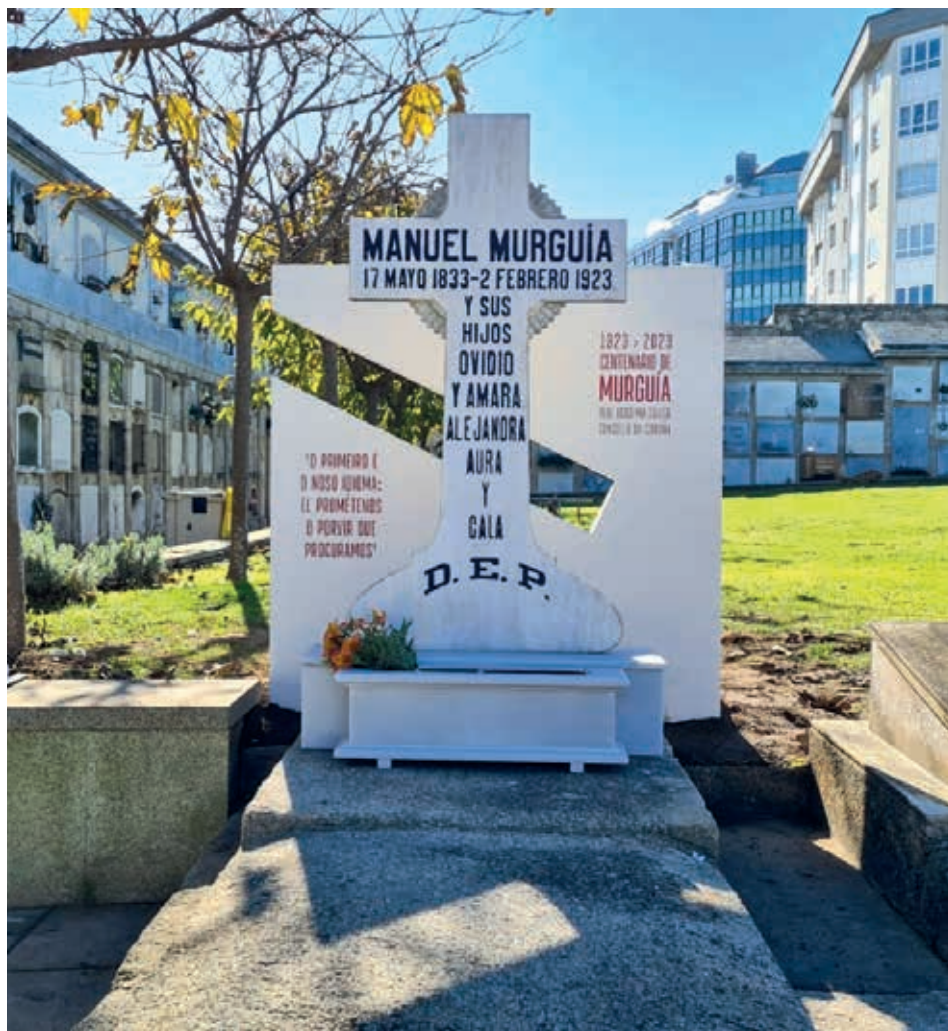
Tumba de Manuel Murguía no cemiterio de Santo Amaro da Coruña, coa placa colocada pola Real Academia e o Concello da Coruña no seu centenario en 2023. O deseño de Pepe Barro, realizado en prefabricado de formigón branco de alta densidade, recolle o principal trazo gráfico da bandeira galega, a súa banda transversal