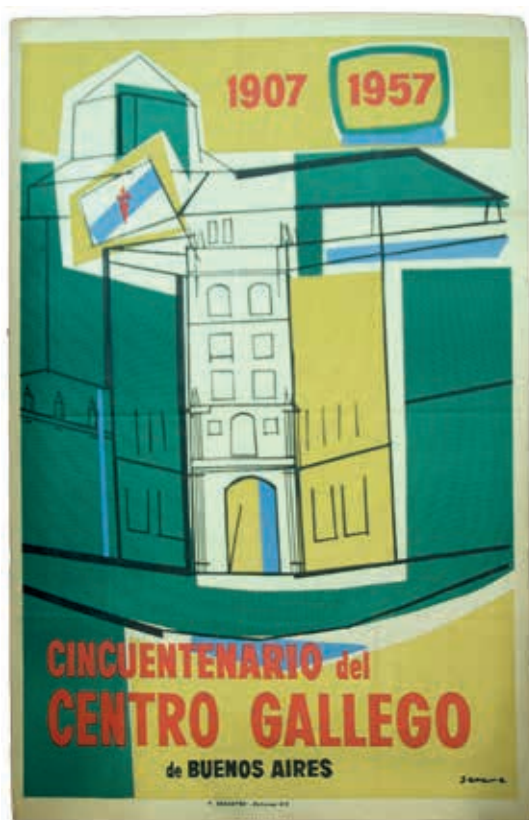
Cartaz deseñado por Luis Seoane para o cincuentenario do Centro Galego de Buenos Aires, 1957. A bandeira galega coa Cruz de Santiago aparece izada na fachada do sede social. A peza consérvase na Fundación Penzol