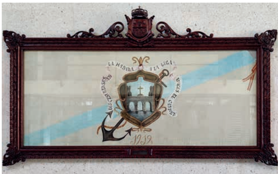
Bandeira galega de 1912, conservada no concello de Pontecesures. Fora un agasallo dos cesureses residentes na Habana á Liga de Amigos El Carmen